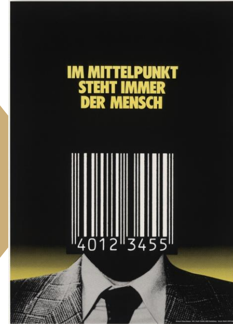
Klaus Staeck, 1981